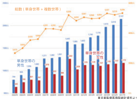
自宅住居で亡くなった単身世帯の者の統計